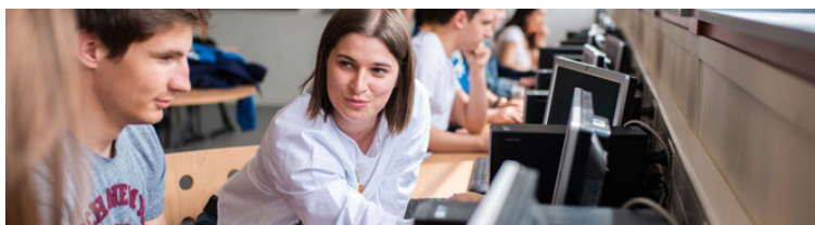
Gestion des entreprises et des administrations