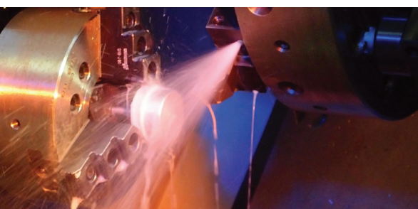
Usinage d'une pièce