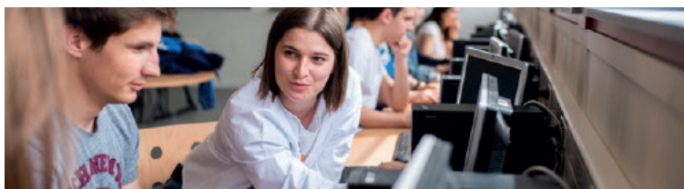
Gestion des entreprises et des administrations