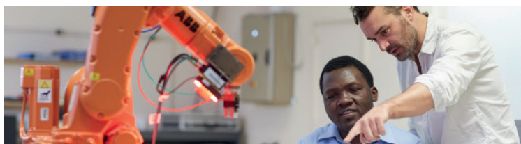
Génie mécanique et productique